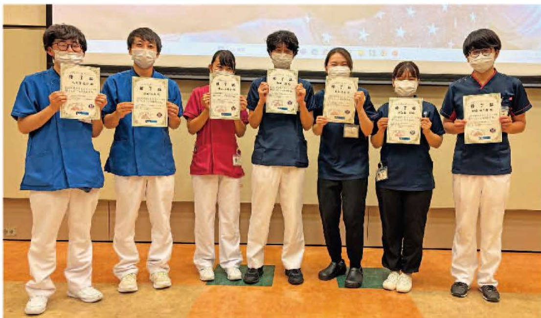
参加者全員に修了証が授与されました