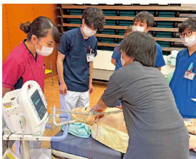
除細動などについての実習