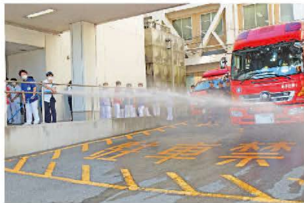
消火栓の放水訓練

9月13日、院内で消防・避難訓練を実施しました。新棟6階病棟のコインランドリーより出火したとの想定で、6階から救助袋を使用した避難訓