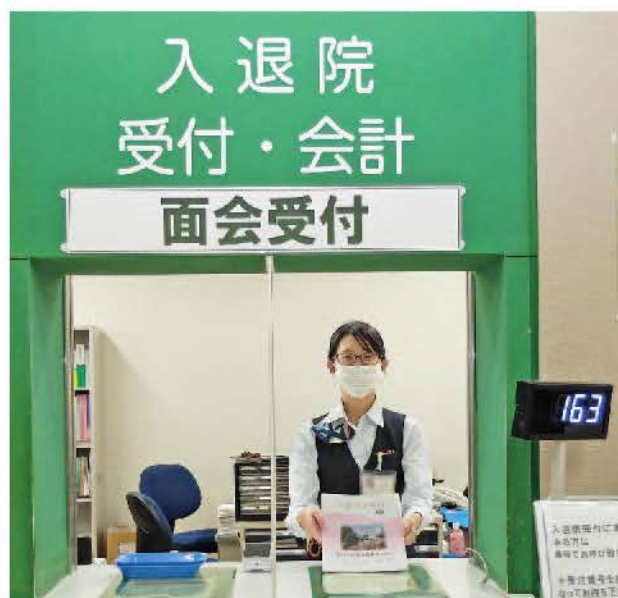
入退院受付・会計 面会受付窓口