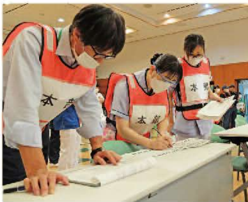
対策本部で情報収集する職員

9月13日、院内で消防・避難訓練を実施しました。新棟6階病棟のコインランドリーより出火したとの想定で、6階から救助袋を使用した避難訓