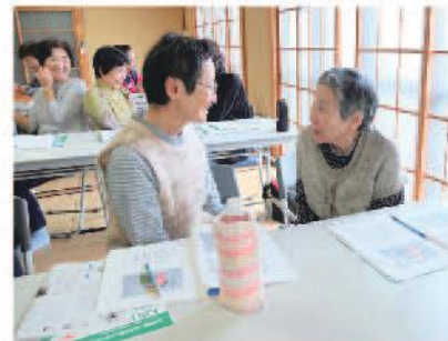
ロールプレイの様子

「桑ちゃんクラブ」の皆様から昨年に引き続き今年も出前講座のお申し込みを頂き、11月9日、桑原集会所で開催し16名の方が参加されました。今回は認知症の方の介護についてのご希望があり、「ユマニチュード」認知症の方とのかかわり方」というテーマで、保